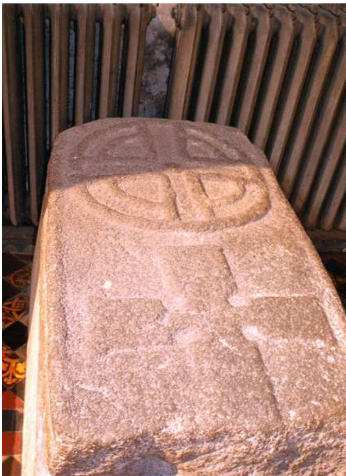
Kamień znaleziony w pozostałości studni, nieopodal Katedry św. Patryka.

Irlandia jaką znano przez wieki odchodziła powoli w zapomnienie, ostatni wielki król Rory O'Connor zmarł w 1198 roku, w tym czasie Zielona Wyspa podlegała już coraz większej kontroli króla angielskiego, a władza lokalnych przywódców malała.